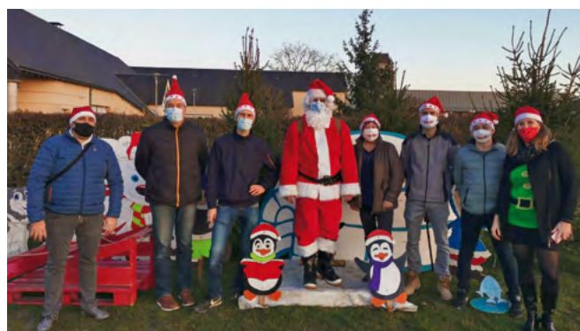
La relève s'organise