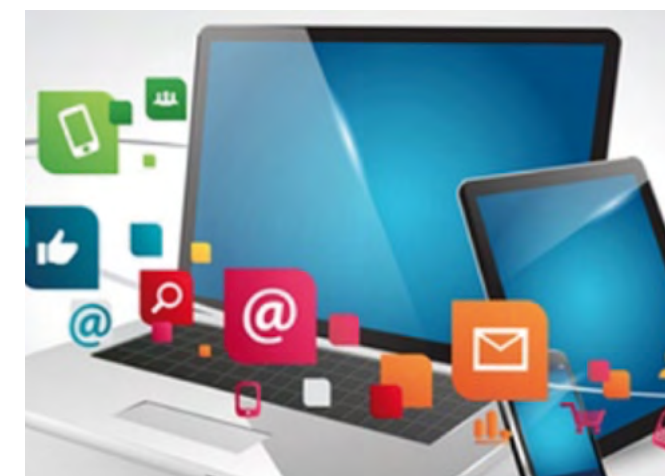
Mystères de l'informatique