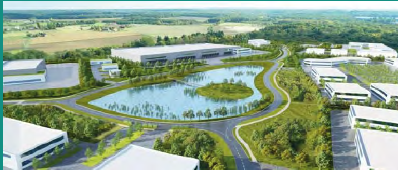
Projet d'écoparc Cosmetic Park®

Situé au nord d'Orléans Métropole sur les communes de Boigny-sur-Bionne et de Venneçy (Communauté de Communes de la Forêt), le Cosmetic Park® est un éco parc de haute qualité fonctionnelle, architecturale et environnementale, développé par JBD Expertise pour la foncière AREFIM et dessiné par l'architecte A26-GL. Jeudi 27 juin 2019, la réalisation du Cosmetic Park® se concrétise avec la pose de la première pierre du premier bâtiment d'activités , dédié aux Parfums Christian Dior, marquant le fort ancrage de l'entreprise de cosmétique mondiale sur le territoire orléanais.