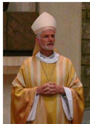
Monseigneur Blaquart, évêque d'Orléans