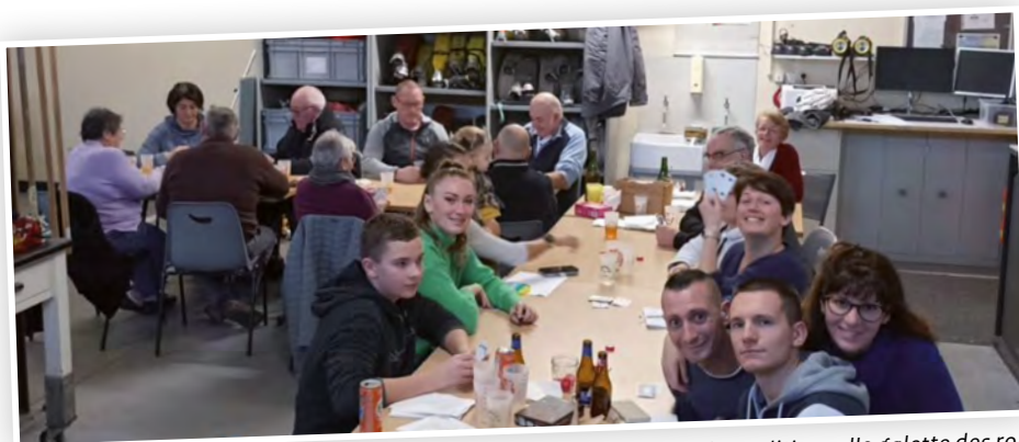
Moment de convivialité autour de la traditionnelle galette des rois